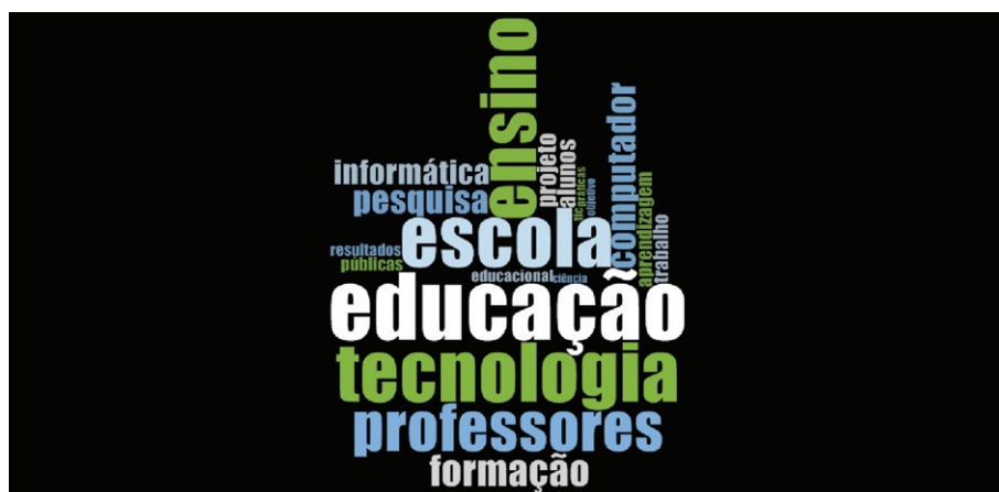
Figura 2. Mapa de nube producido con el software NVivo, sobre las frecuencias de palabras clave en las publicaciones sobre el tema políticas públicas/gestión (tesis, disertaciones, artículos en periódicos y en anales de eventos)

Las referencias de las palabras de la tabla 3 también pueden ser observadas en el mapa de nube de la figura 2.